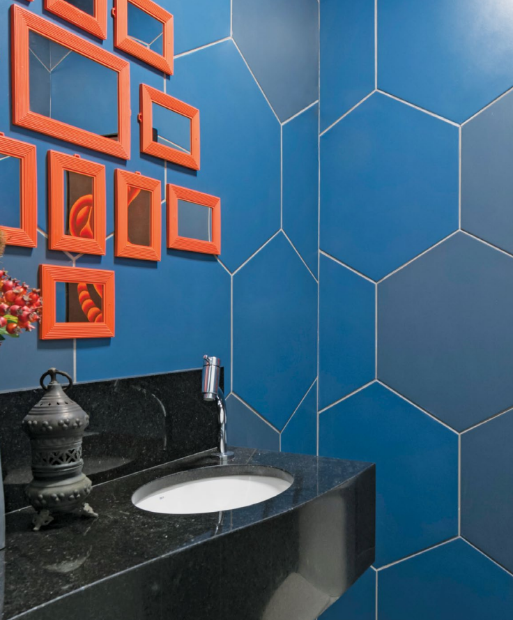
PROJETOS DO BANHEIROS: MIS ARQUITETURA , @misarquitetura