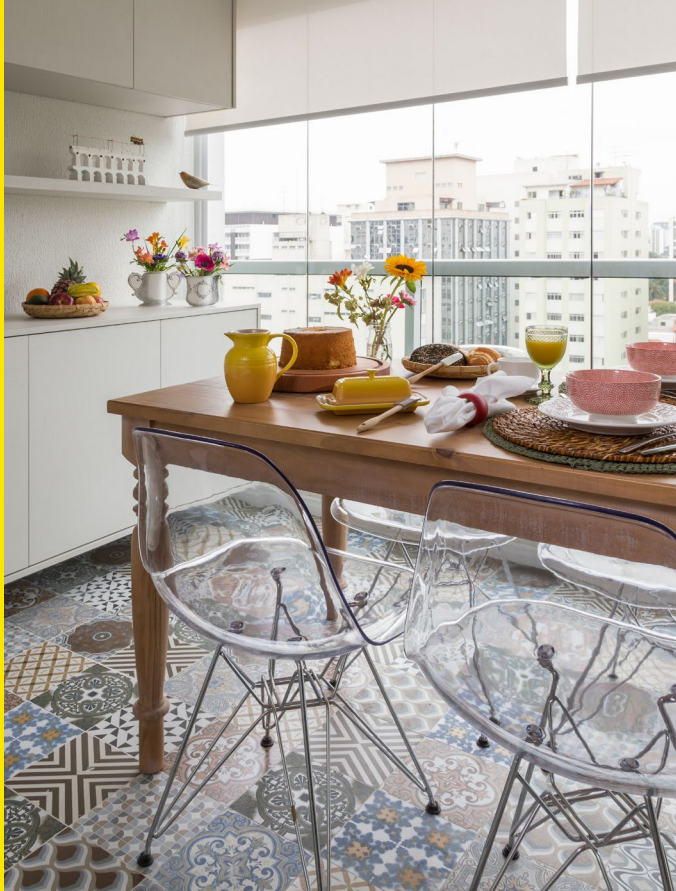
PROJETO: NEWTON LIMA , @newtonlimaoficial